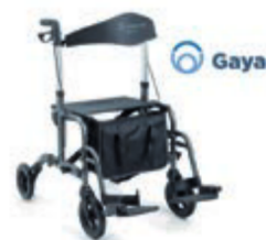
CHODÍTKO S PODNOŽKAMI GAYA