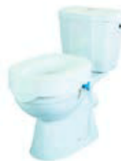
NÁSTAVEC NA WC 10 CM S FIXACÍ REHOTEC