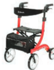
CHODÍTKO ODLEHČENÉ 102