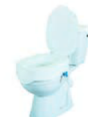
NÁSTAVEC NA WC 13 CM POKLOP REHOTEC