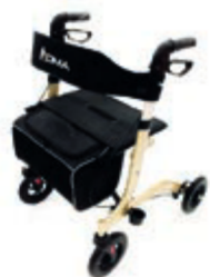
CHODÍTKO ODLEHČENÉ 101