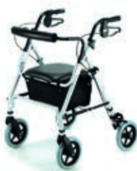
CHODÍTKO ODLEHČENÉ 103