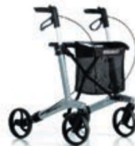
CHODÍTKO GEMINO 20