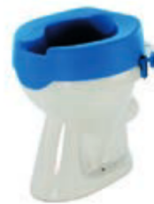
NÁSTAVEC NA WC 508 VYMĚKČENÝ