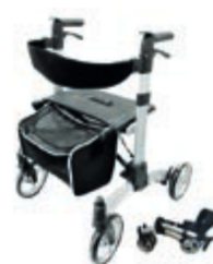
CHODÍTKO SKLÁDACÍ 104