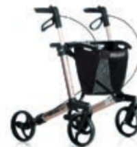
CHODÍTKO GEMINO 30