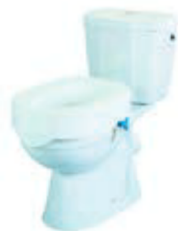
NÁSTAVEC NA WC 7 CM S FIXACÍ REHOTEC