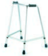
ČTYŘBODOVÉ CHODÍTKO ŠIROKÉ 202 EL