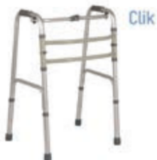
CHODÍTKO POHYBLIVÉ MOPEDIA RP749L