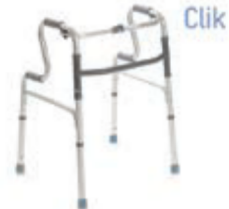
CHODÍTKO DVOUSTUPŇOVÉ MOPEDIA RP747