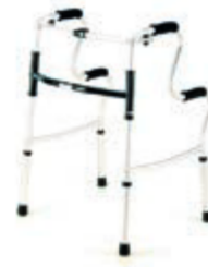
ČTYŘBODOVÉ CHODÍTKO SKLÁDACÍ 230