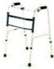
ČTYŘBODOVÉ CHODÍTKO KROKOVACÍ 230 EL