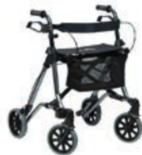
CHODÍTKO TAIMA M ECO