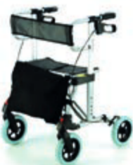
CHODÍTKO ODLEHČENÉ 105