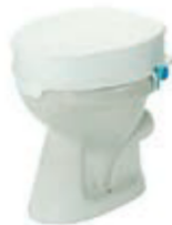
NÁSTAVEC NA WC 575 B DELUXE 10 CM POKLOP