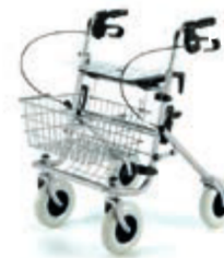
ČTYŘKOLOVÉ CHODÍTKO 100