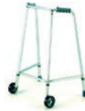
DVOUKOLOVÉ CHODÍTKO STŘEDNÍ 206 ELC